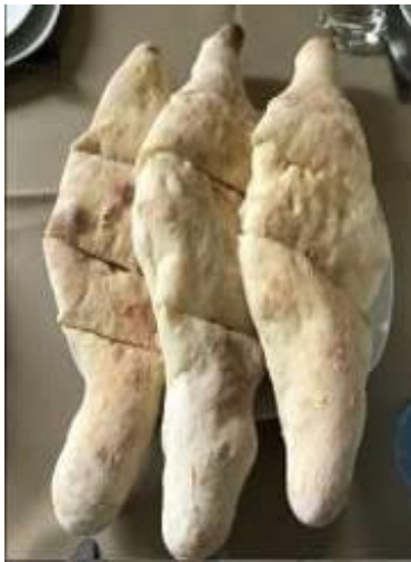
- คาชาปური ขนมนุ่มปัง ไล่ชีสเยี่ยมๆ

“Churchkhela” ขนมหวานทานเล่นที่ขึ้นชื่อ เป็นเม็ดถั่วทองฉ่ำร้อยเข้าด้วยกันเป็นแถวยาวแล้วชุบด้วยแป้งเคี้ยวน้ำตาล